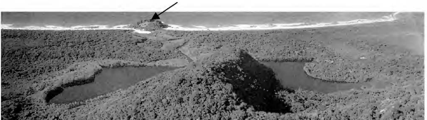
Fig.2- Sítio Ilhote do Leste.

É à volta do Ilhote do Leste que está a maior concentração de amoladores-polidores fixos encontrada na Ilha Grande. Eles também estão no costão rochoso que o cerca, indicando que foram feitos numa época em que o mar estava mais baixo, quando a barra dos canais de drenagem ficava mais à frente. As lâminas de machado encontradas no sítio, sempre associadas aos enterramentos, comprovam a relação dos habitantes do sítio com os amoladores polidores fixos (Fig.3).